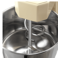
S/S bowl and shaft